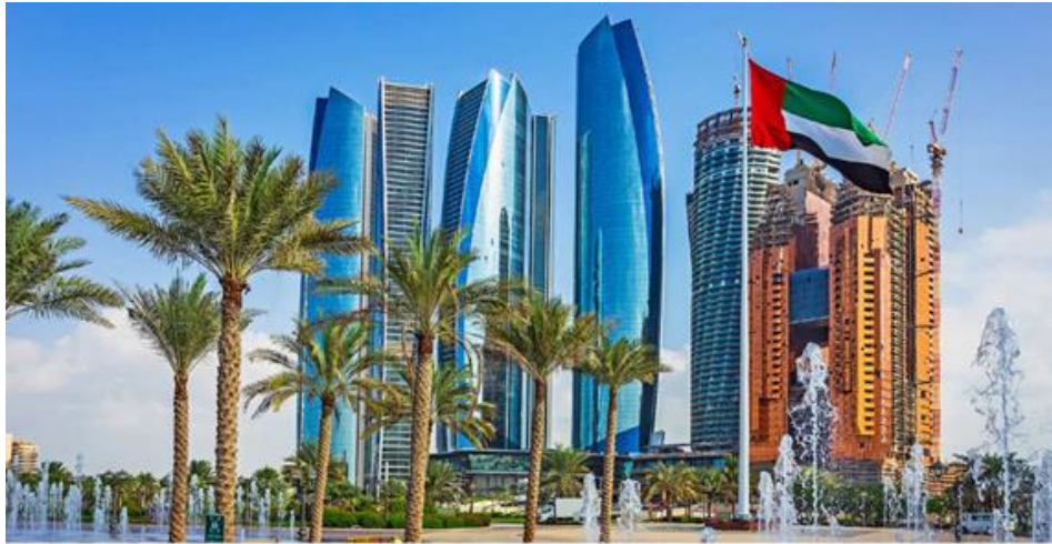
Etihad Towers in Abu Dhabi